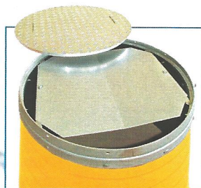
Couvercle de la buse avec sécurité enfants

Pendant le remplissage dans le chantier avec de la pierraille la cuve sera consolider automatiquement à cause de la nouvelle forme.